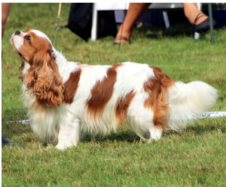
Giggling Outlander (Gucci) har blivit dansk och svensk champion