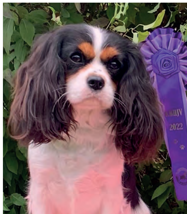
Zinkitens Viktualia (Belle) blev svensk juniorvinnare 2022