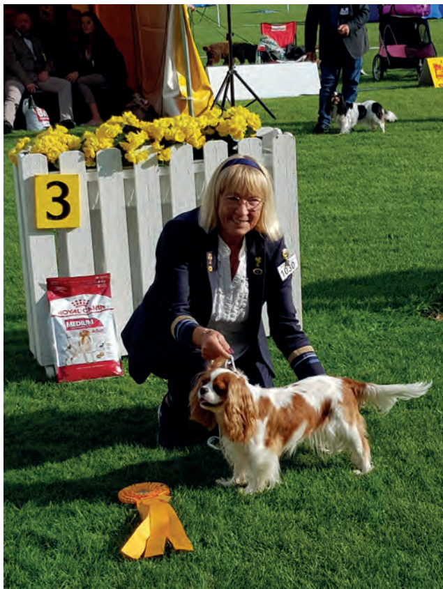
SEUCH DKUCH Toftas Kamelia Certifikat